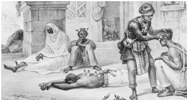
Aquarela de Jean-Baptiste Debret, 1826.

No Rio de Janeiro do século XIX, os médicos, cirurgiões e boticários eram em sua maioria brancos e pertenciam a classes sociais mais abonadas. Já os sangradores, curandeiros, parteiras e amas de leite eram quase sempre escravos, libertos e pessoas livres empobrecidas, entre elas imigrantes e africanos livres. Era essa população desfavorecida que tratava dos problemas de saúde mais urgentes de quem precisava, não importava se ricos ou pobres. Os sangradores ofereciam seus serviços pelas ruas e praças das cidades e em lojas de barbeiros, enquanto as parteiras trabalhavam em ambientes domésticos, cuidando de questões relacionadas não apenas ao parto, mas também a abortos e doenças genitais.