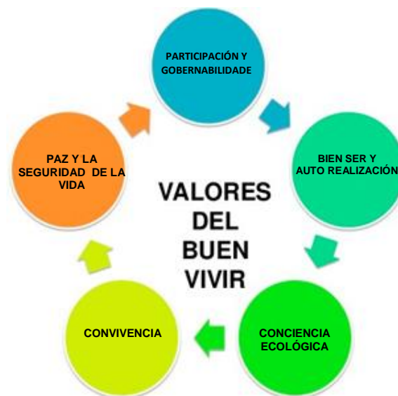
Imagen: https://tiduscoop.wordpress.com/2016/06/26/buen-vivir-o-vivir-mejor/ accedido en el 21/01/2024

A continuación, analice la imagen y responda las preguntas 19 y 20.