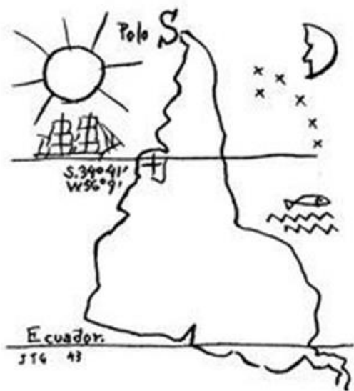
América Invertida, dibujo de Joaquín Torres García, hecho en 1943.